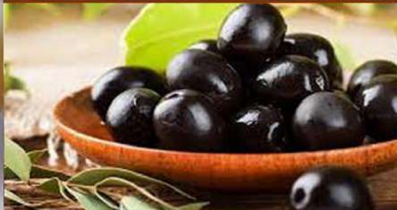
OLIVE NERE CON NOCCILOLO