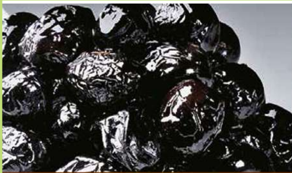
NERE AL FORNO CONDITE