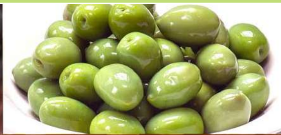
OLIVE VERDI CON NOCCILOLO