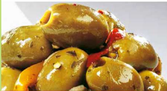
OLIVE VERDI SCHIACCIATE CONDITE