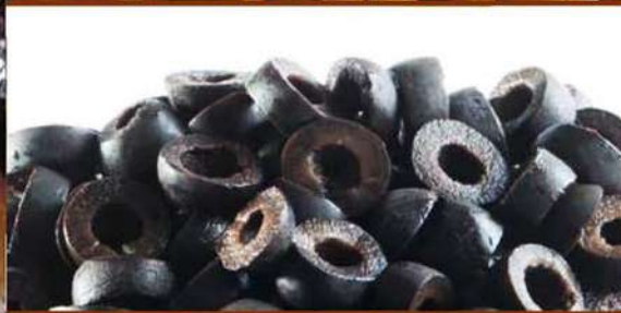
NERE A RONDELLE