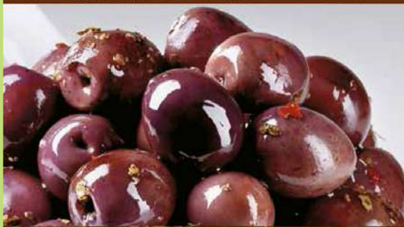
OLIVE NERE MONACALI