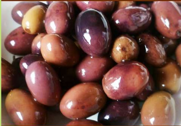
OLIVE NERE EXTRA JUMBO IN SALAMOIA