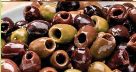
OLIVELLE RIVIERA DENOCCIOLATE